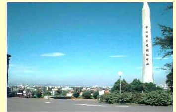
▲大門旁的中大在台復校紀念碑·象徵中大的崛起與茁壯。