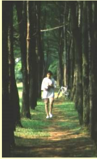
▲漫步者·偷得浮生半日閒·享受一下難得的恬靜。