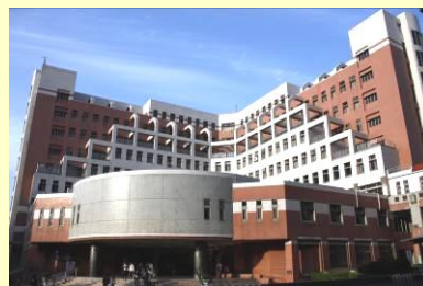
▲管理學院-管理二館·培育經營管理專才的搖籃。