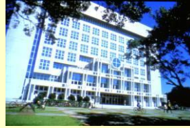
▲典藏浩瀚學問的宏偉殿堂 - 圖書館。