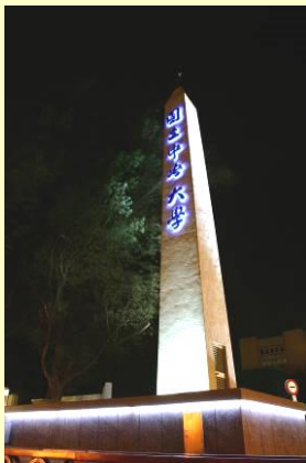
▲夜之中大·閃耀著燈光·也閃耀著學子的青春.....