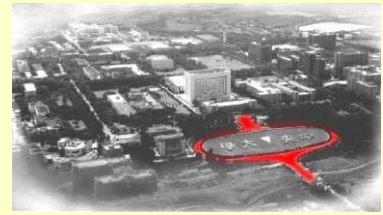
▲雄偉的大學之門·是任何一個學校都無法比擬的。